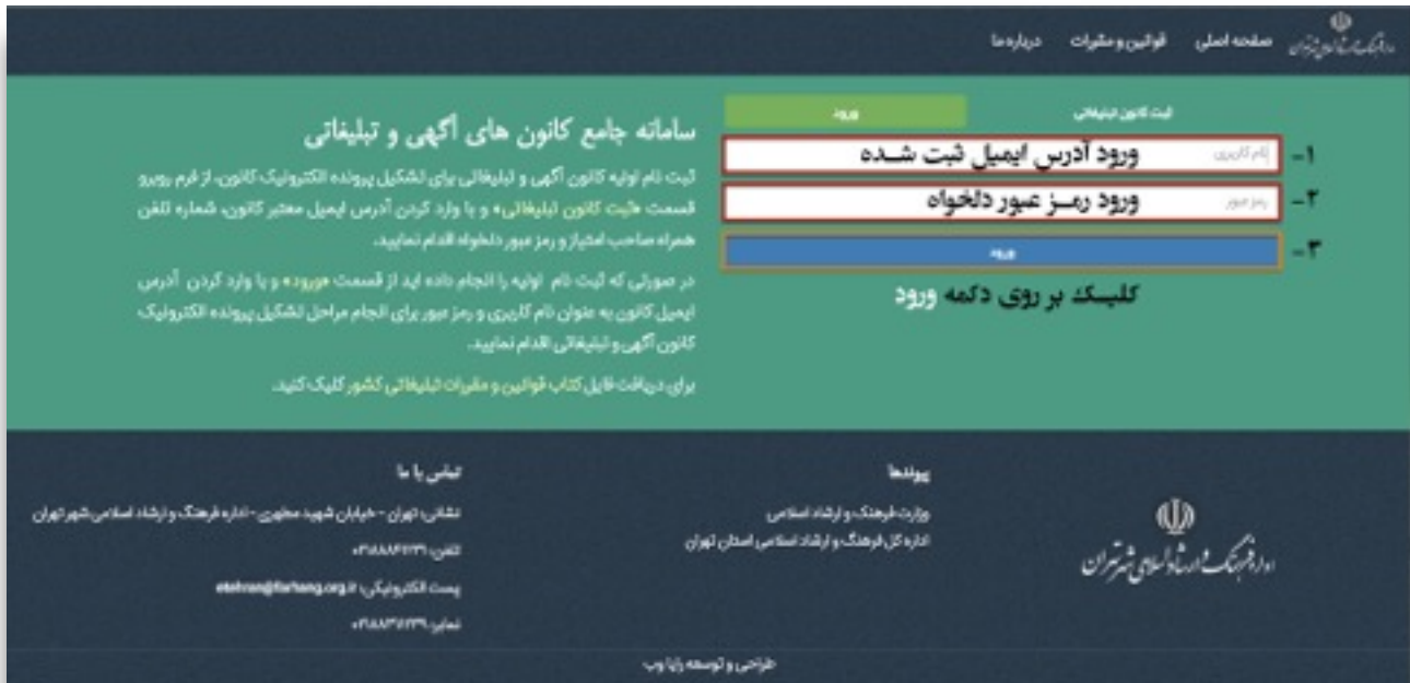
شکل ۳) نحوه تکمیل فرم ورود