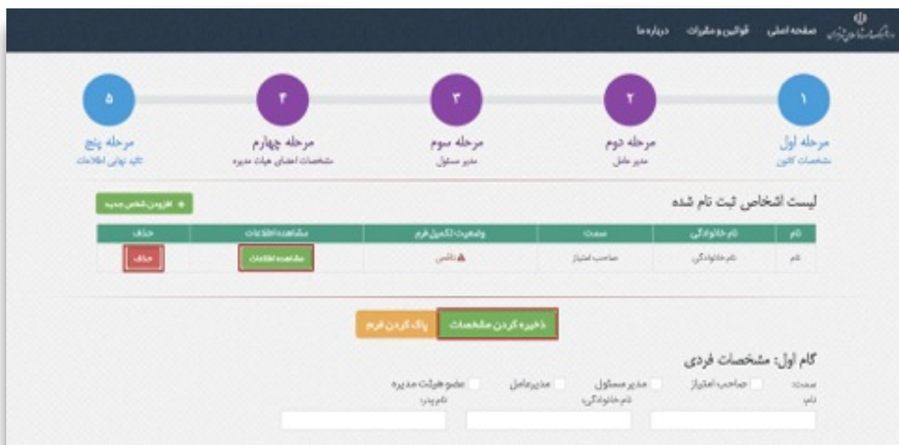
شکل ۹) جدول لیست اشخاص ثبت نام شده

در صورتی که قصد ادامه ورود اطلاعات فرد را داشته باشید کافی است بر روی گزینه مشاهده اطلاعات را کلیک کرده و با نماش اطلاعات قبلی، اطلاعات جدید را وارد نمایید.