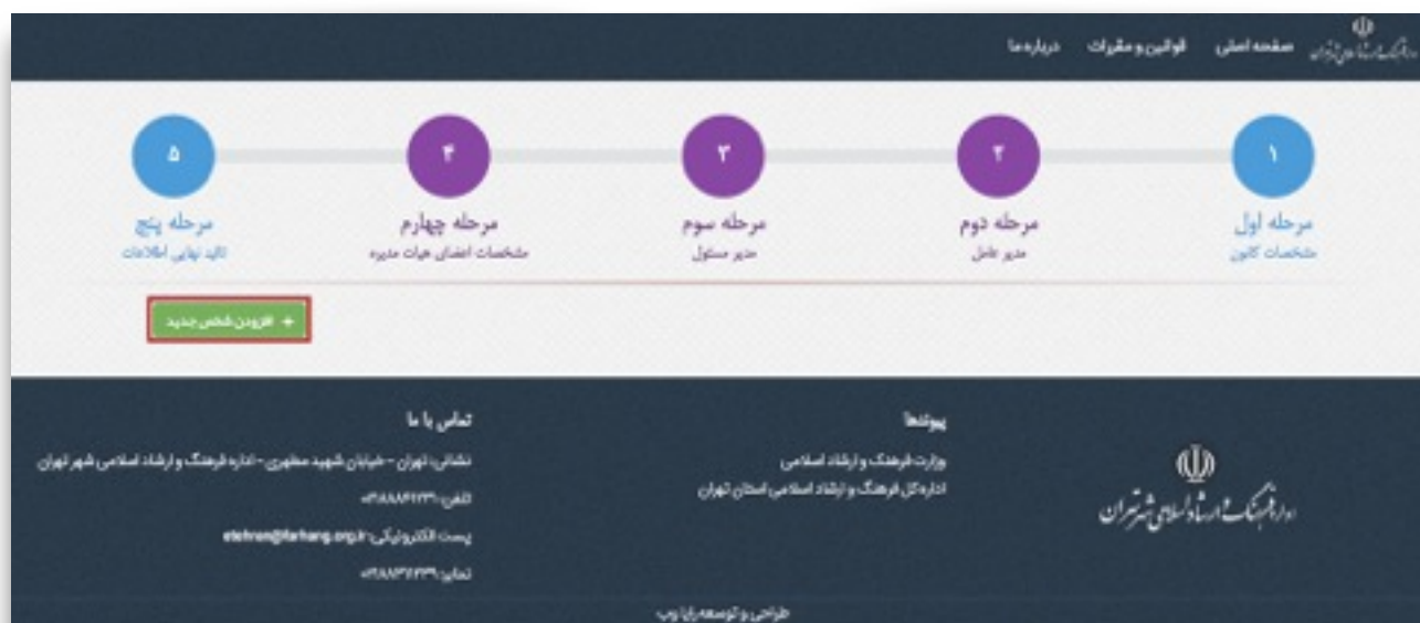
شکل ۷) نحوه افزودن شخص جدید

۱- بعد از ورود به این مرحله، شما می‌بایست بر روی گزینه افزودن شخص جدید کلیک کنید. (شکل ۶) فرم تکمیل شده مشخصات کانون